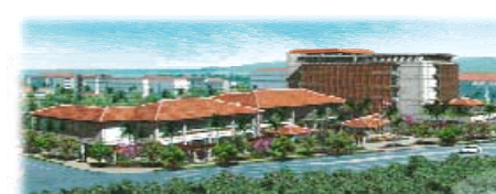
中核機能支援施設