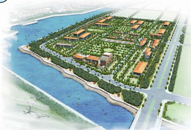
沖縄IT津梁パーク全体図